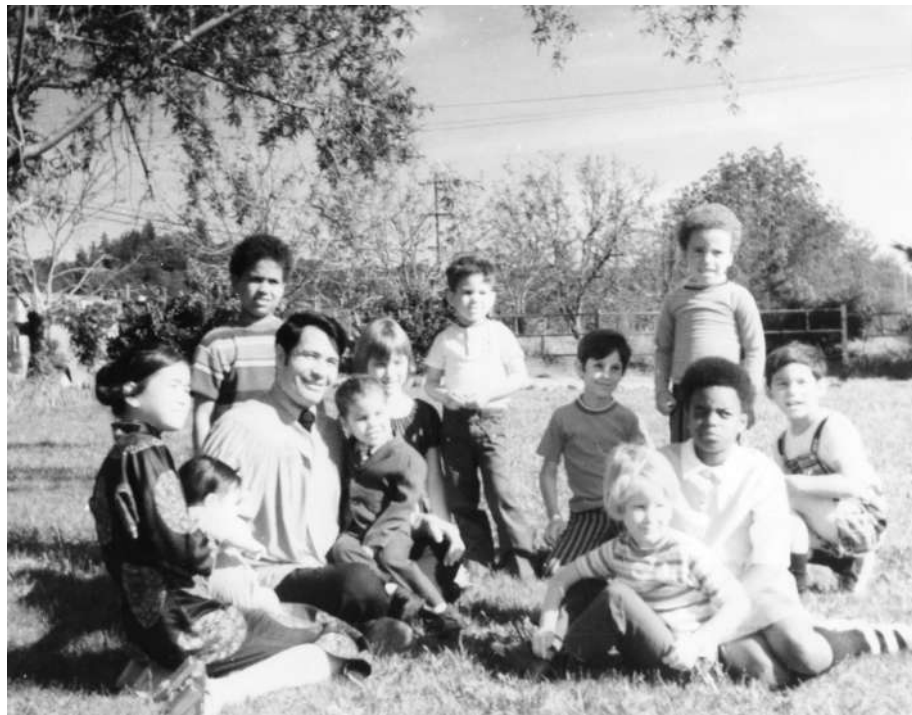
Jim Jones et sa famille « arc-en-ciel »

De façon joyeuse et participative, les deux comédiens vont chercher à éprouver la puissance des mots et le poids des discours, lorsque ceux-ci deviennent les instruments insidieux de l'enfermement sectaire et de la manipulation. Sans apporter de réponse, le spectacle invite à une réflexion poétique et ludique sur les notions de libre arbitre, de groupe, de choix, de rapport à l'autorité et de construction de l'identité.